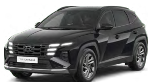
Abyss Black Pearl Perleťová Cena: 0 Kč