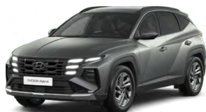
Pine Green Matt Matná Cena: 15 000 Kč