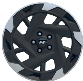
19" kola z lehké slitiny N Line