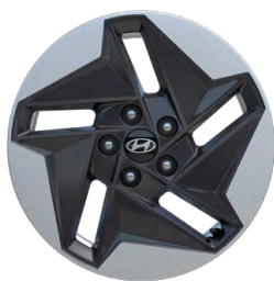
17" kola z lehké slitiny