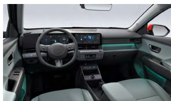
Šalvějově zelený interiér – kožené čalounění sedadel – výhradně pro Style Premium