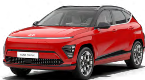
Engine Red Pastelová Kombinace s černým lakováním střechy Cena: 0 Kč