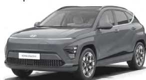
Ecotronic Gray Perleťová Kombinace s černým lakováním střechy Cena: 17 900 Kč