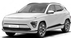
Atlas White Speciální pastelová Kombinace s černým lakováním střechy Cena: 10 000 Kč