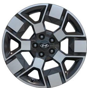
19" kola z lehké slitiny