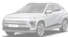
Shadow Grey Speciální pastelová Kombinace s černým lakováním střechy Cena: 17 900 Kč Pouze pro N Line