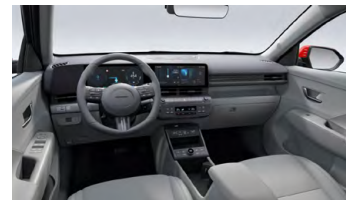
Šedý interiér – látkové čalounění sedadel – dostupné pro Smart, Czech edition