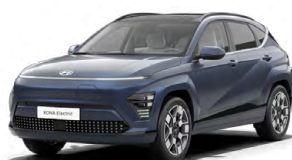
Sailing Blue Perleťová Kombinace s černým lakováním střechy Cena: 17 900 Kč