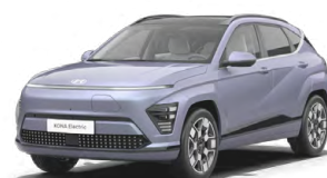
Meta Blue Pearl Metalická Kombinace s černým lakováním střechy Cena: 17 900 Kč