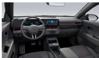
Černý interiér N Line – látkové čalounění sedadel – výhradně pro N Line