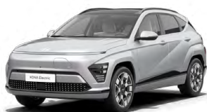
Shimmering Silver Metalická Kombinace s černým lakováním střechy Cena: 17 900 Kč