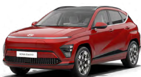
Ultimate Red Metalická Kombinace s černým lakováním střechy Cena: 17 900 Kč