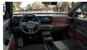
Černý interiér N Line Premium – čalounění sedadel kůže/semiš – výhradně pro N Line Premium

www.porovnejhyundai.cz (Porovnejte si vozy Hyundai s konkurencí)