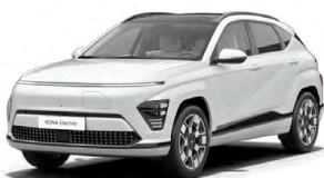
Serenity White Perleťová Kombinace s černým lakováním střechy Cena: 17 900 Kč