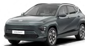
Cypress Green Perleťová Kombinace s černým lakováním střechy Cena: 17 900 Kč