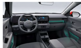
Eco interiér – čalounění sedadel kůže/semiš – výhradně pro Style