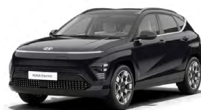
Abbyss Black Pearl Perleťová Cena: 17 900 Kč