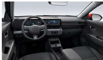
Černý interiér – látkové čalounění sedadel – dostupné pro Smart, Czech edition