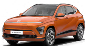
Jupiter Orange Metalická Kombinace s černým lakováním střechy Cena: 17 900 Kč