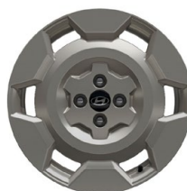
17" kola z lehké slitiny Cross

www.porovnejhyundai.cz (Porovnejte si vozy Hyundai s konkurencí)