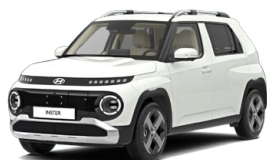
Atlas White Pastelová Cena: 6 900 Kč Kombinace dostupná také s černým lakováním střechy