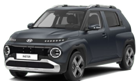
Dusk Blue Matte Matná metalická Cena: 15 900 Kč Nelze pro Cross, Cross Premium