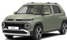
Bijarim Khaki Matte Matná metalická Cena: 15 900 Kč Nelze pro Cross, Cross Premium