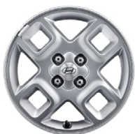
15" kola z lehké slitiny