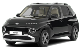
Abyss Black Pearl Perleťová Cena: 12 900 Kč