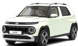
Unbleached Ivory Patelová Cena: 0 Kč