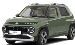
Tomboy Khaki Pastelová Cena: 12 900 Kč Kombinace dostupná také s černým lakováním střechy