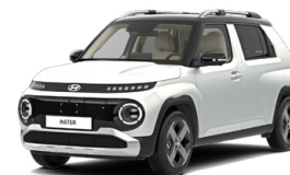
Aero Silver Matte Matná metalická Cena: 15 900 Kč Kombinace dostupná také s černým lakováním střechy