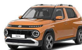
Sienna Orange Metallic Metalická Cena: 12 900 Kč Nelze pro Cross, Cross Premium Kombinace dostupná také s černým lakováním střechy