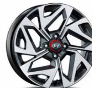
16" kola z lehké slitiny

12 Záruka 12 let na prorezivění karoserie.